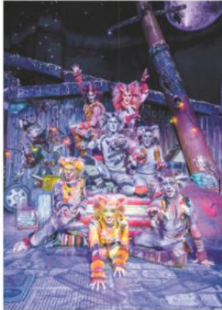
El musical Cats es uno de los montajes que actualmente se presentan en la Ciudad de México.

EL ISEP, que hasta el año pasado era subsidiado por el gobierno de la Ciudad de México, haría incosteables las obras