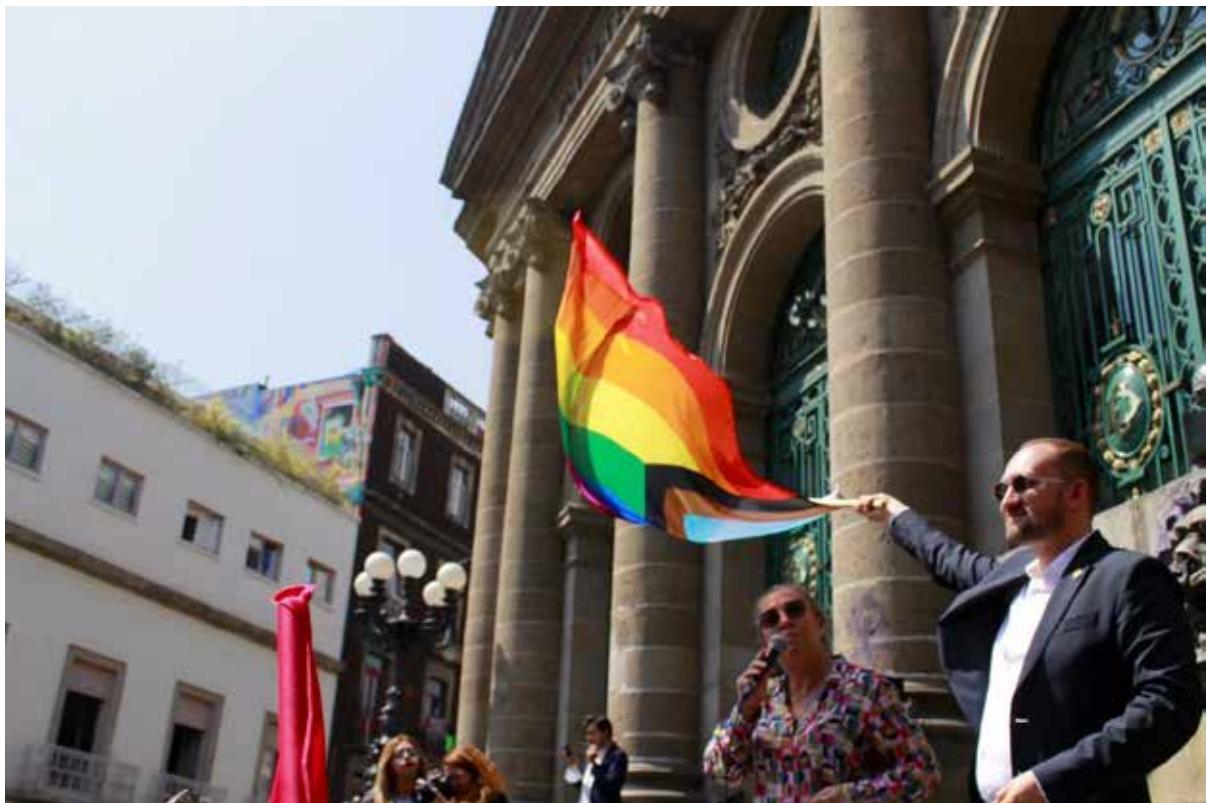
15. Protesta de vogueing

En el Día contra las LGTBfobias y al ritmo de vogue, junto con la diputada Ana Francis, se organizó una protesta pacífica para seguir defendiendo y exigir una Ciudad en favor de la inclusión y representación.