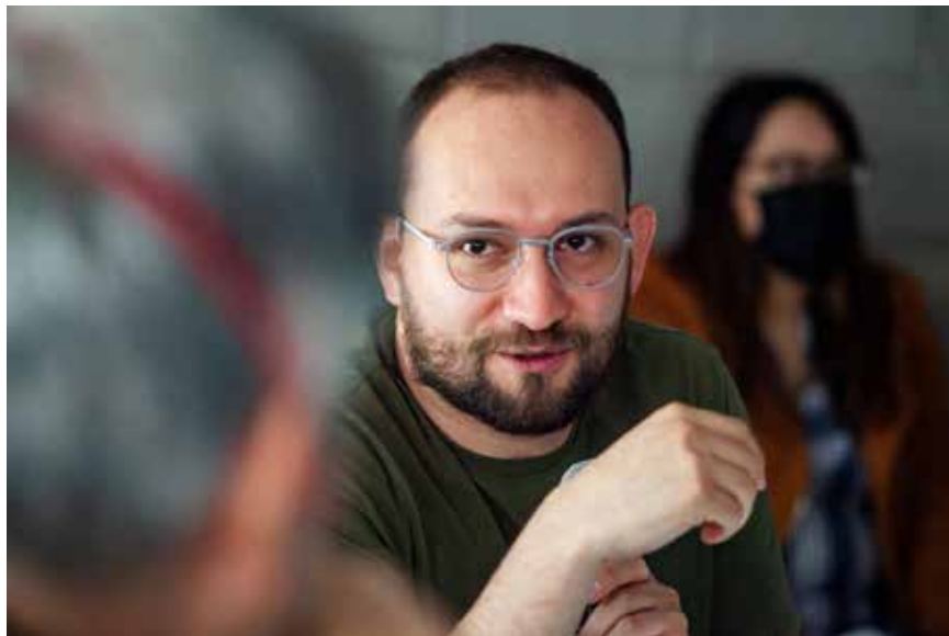
9. Reunión con COPRED

Mesa consultiva con COPRED CDMX, para revisar el paquete legislativo sobre la erradicación de la discriminación.