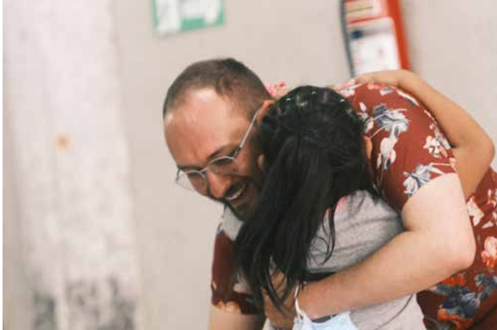
19. Entrega de lentes a niñas, niños y adolescentes