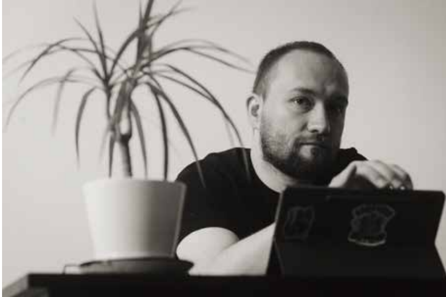
8. Sesiones en línea de diversas comisiones