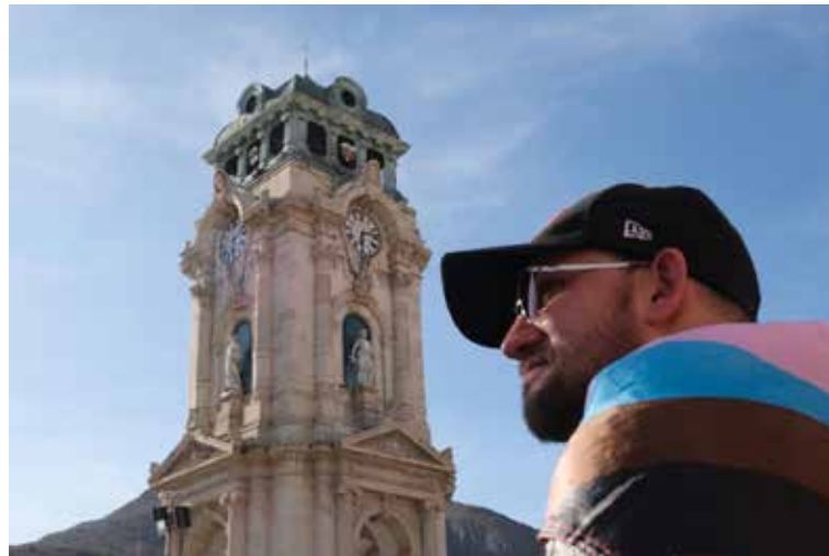
17. Marcha del Orgullo en Hidalgo

22° Marcha del Orgullo en Pachuca, Hidalgo.