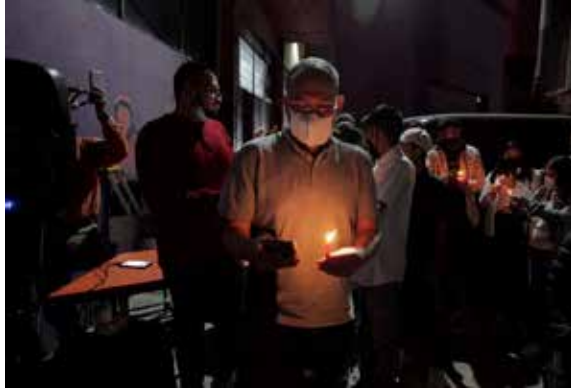
6. Posada con vecinas y vecinos de la colonia Atlampa