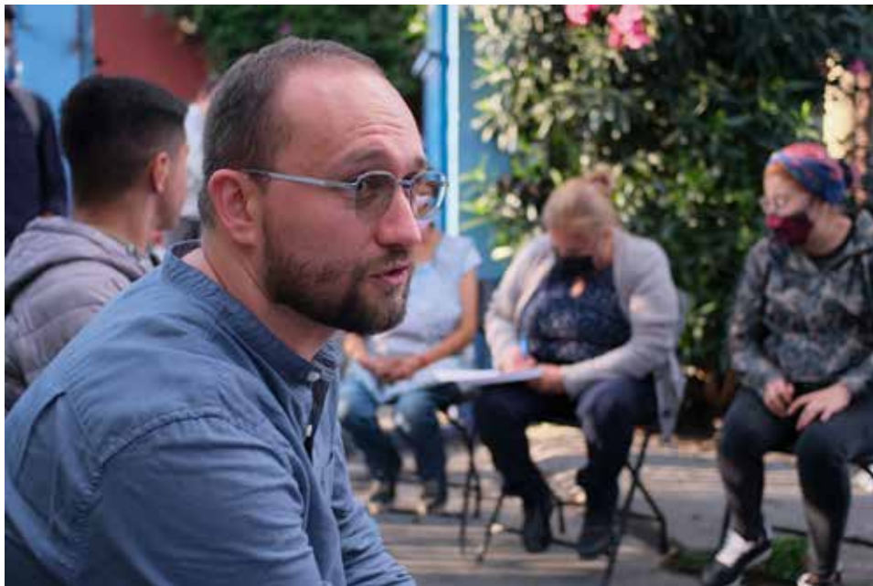
18. Asamblea Vecinal

Conferencia de prensa sobre la inauguración del Festival Mix film fest.