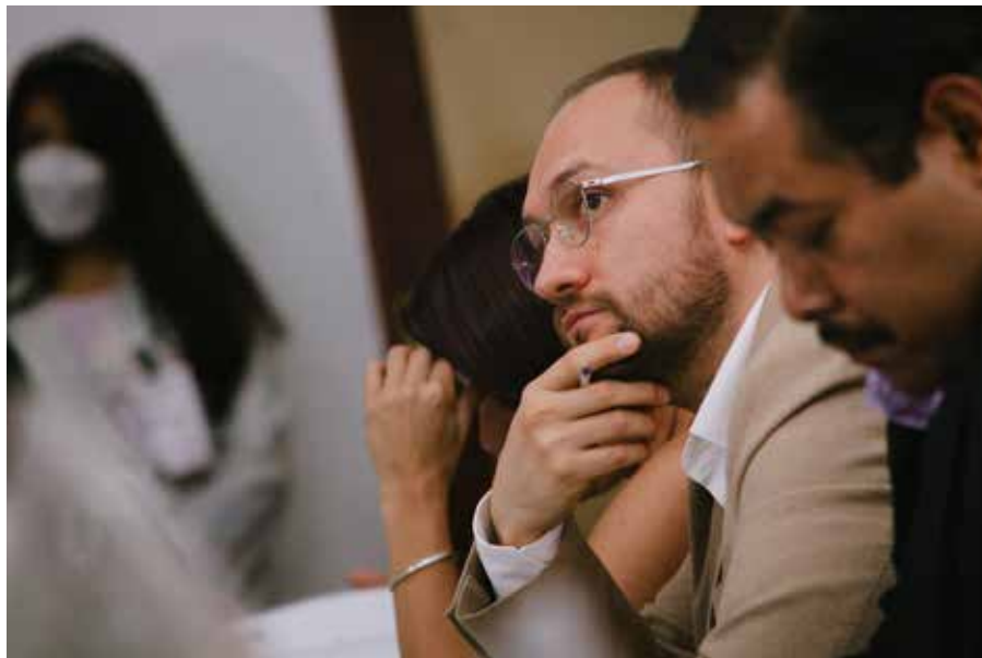
16. Mesa de trabajo con la alcaldía

https://www.youtube.com/watch?v=e0ba_Kw6DkE