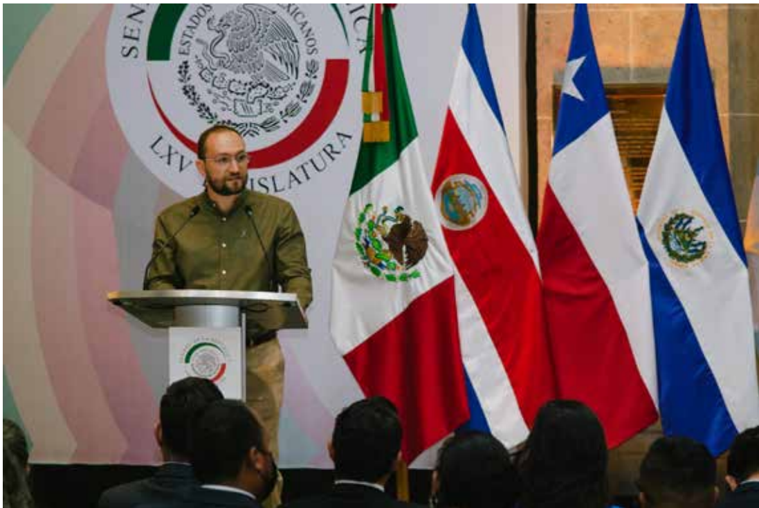
11. Global Equality Caucus

https://twitter.com/TemistoclesVR/status/1510089502689222658?s=20&t=bTU0Edk6bvq-Yzyu6hijcA