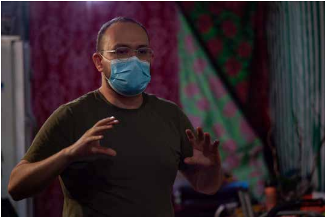
10. Asamblea vecinal

Publicación de la Postal por el Día De La Visibilidad Trans