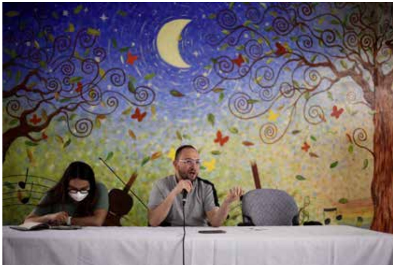
21. Mesa de trabajo con Espacios Culturales Independientes

Reunión con colectivos culturales para escuchar sus observaciones a la Ley de Espacios Culturales Independientes.