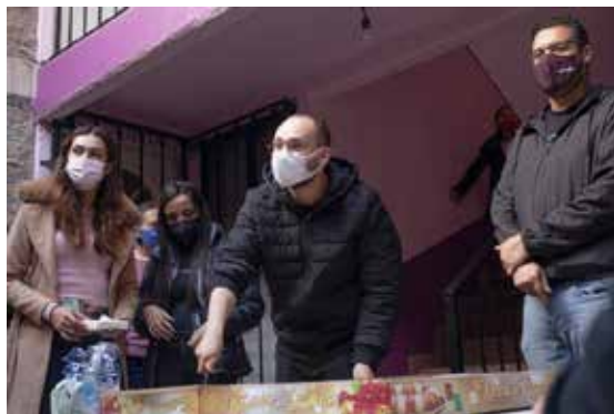
7. Reunión con vecinas y vecinos en la colonia Santa María la Ribera.

Agua para el futuro: más allá de las rencillas partidistas | El Heraldo de México (heraldodemexico.com.mx)