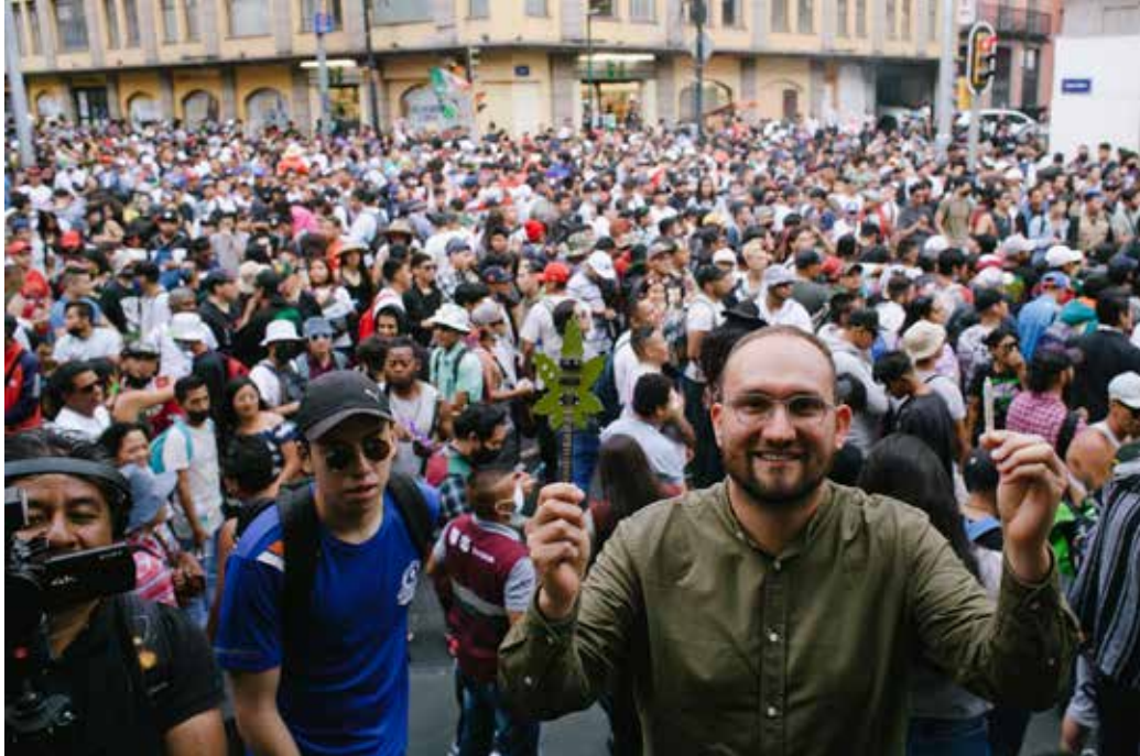
12. Marcha 420