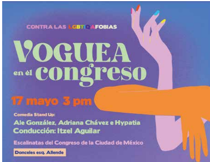
14. Evento de Voguing