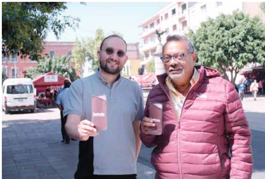
24. Entrega de lentes

Entrega de lentes graduados a las vecinas y vecinos de la Colonia Centro.