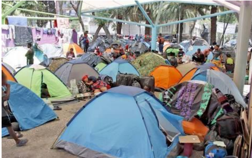
donde se presenta el campamento migrante, ubicado de la plaza Giordano Bruno, en la demarcación Cuauhtémoc.

A raíz de que los campamentos informales se multiplicaron en varias partes de la capital, se ha aumentado la vulnerabilidad de miles de personas migrantes, ya que, de acuerdo a los medios de comunicación, la violencia, los abusos sexuales, la falta de higiene, entre otros problemas, hacen que se vulneren sus derechos humanos. Por lo cual, los mismos habitantes de la Ciudad, han protestado para que dicha situación pueda retomarse, para que las personas migrantes tengan un trato digno.