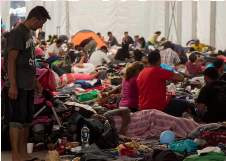
Foto de un albergue migrante en Iztapalapa, recuperado de Redacción Capital Noticias.

Otros de los ejemplos más claros para abordar la problemática, se observa en Iztapalapa, se pudo observar el establecimiento de un campamento cerca de la Central de Autobuses de Oriente 13 .