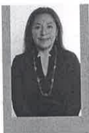
Diputada Xóchitl Bravo Espinosa Integrante