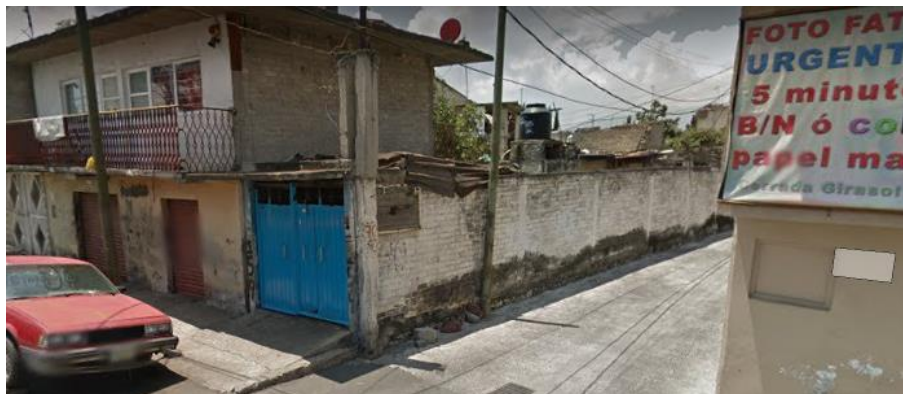
Imagen 1. Vista de la calle Prolongación Hidalgo, col. La Habana, donde la nomenclatura se encuentra borrada y es inexistente