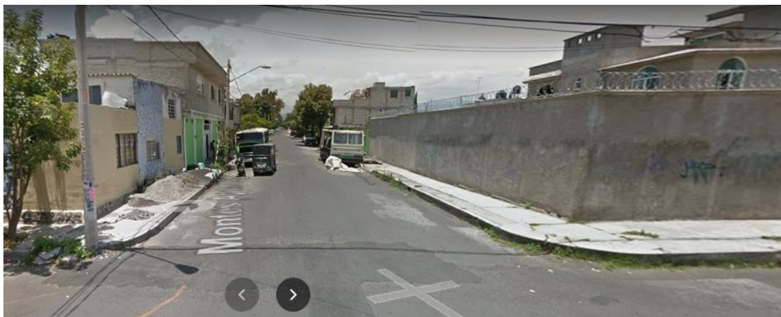
Imagen 2. Vista de la calle Mar de los Humores, col. Selene 2ª secc., donde la nomenclatura es inexistente.