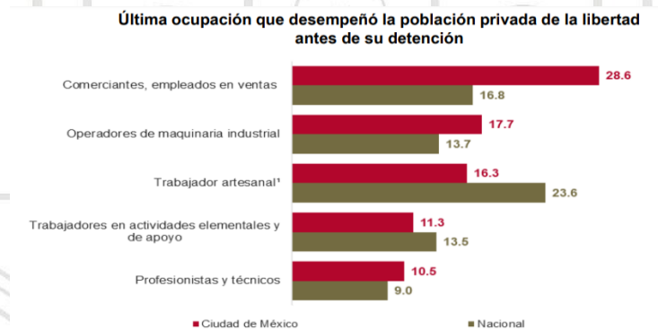
Gráfico recuperado de Instituto Nacional de Estadística y Geografía 2021

Aunado a ello, sólo el 10.5% se desempeñaba en una ocupación de profesionistas y/o técnicos antes de su detención, mientras que el 73.9% laboraban como comerciantes, empleados de ventas, operadores de máquina industrial, trabajador artesanal y como trabajadores de actividades elementales y de apoyo. 11