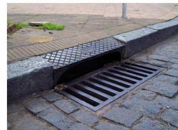
Imágenes de referencia 7