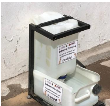
1. Bebedero Ecológico instalado en el parque Mirador de Chihuahua. 11 de agosto de 2021.

En esta orden de ideas, en nuestro país son varios los Estados que se han sumado a esta idea, a saber, el Estado de Oaxaca, que en 2020 ha empezado a instalar comederos para perros callejeros en diversos puntos de la ciudad, todos ellos de materiales reciclados, que han tenido buena aceptación entre la población. 4