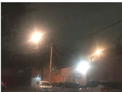
Cuauhtémoc CDMX

Esta es la imagen habitual de cualquier calle de la ciudad de México: