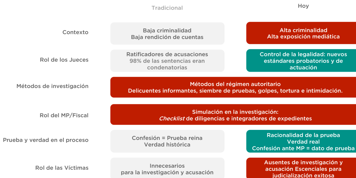
Diagrama 3. Nuevo contexto de operación de investigación en delitos de alto impacto

La tarea de construir capacidades de investigación y persecución en delitos de alto impacto exige que entendamos de dónde venimos, en dónde estamos y a dónde queremos ir. El siguiente diagrama expone 6 dimensiones de análisis que son útiles para entender la evolución de la investigación criminal en delitos de alto impacto y definir estrategias adecuadas para superar los viejos vicios del sistema.