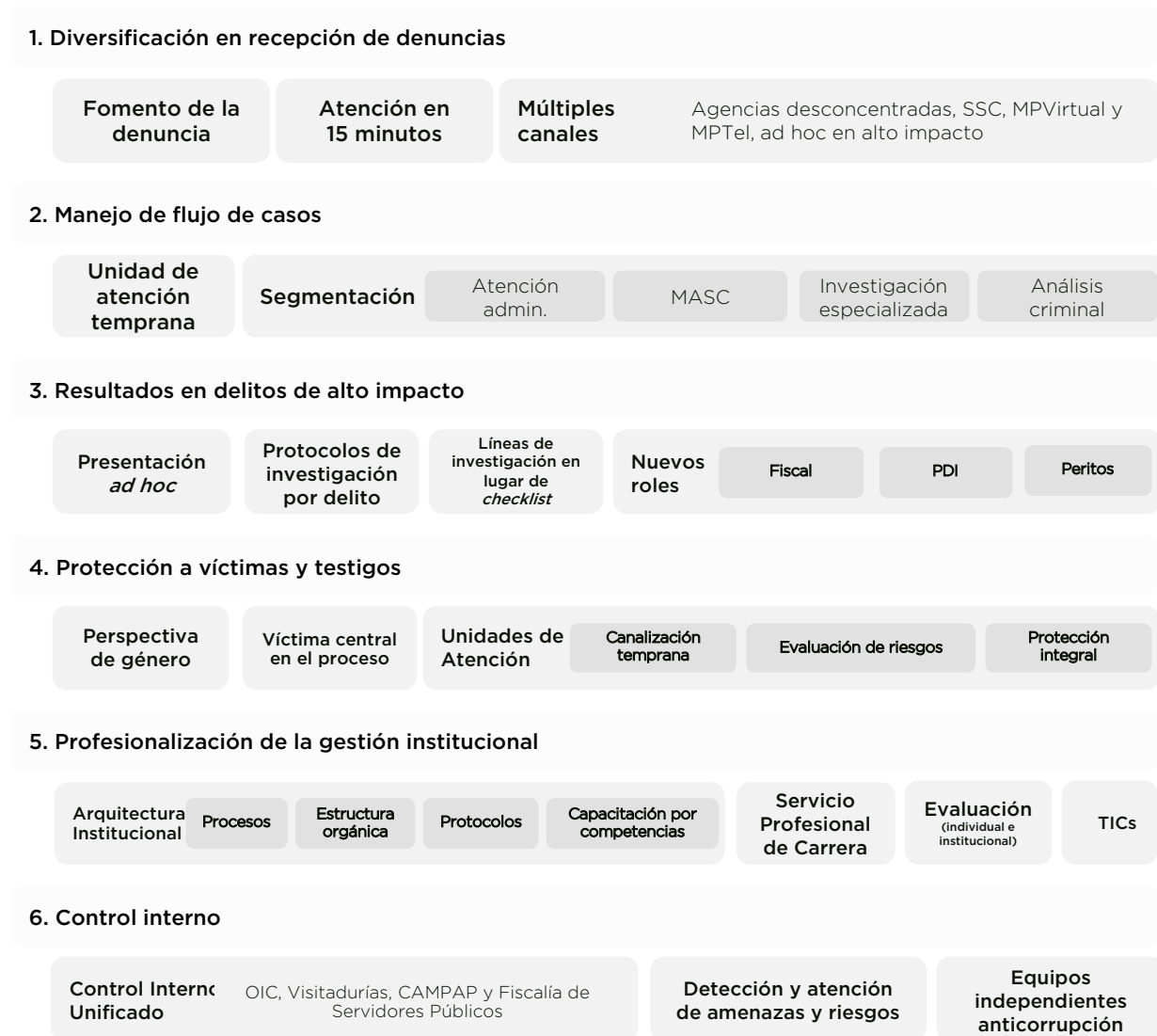
Figura 1. Elementos del modelo de la FGJ

La ruta de transformación que propone esta Comisión Técnica considera seis elementos que se presentan en este documento: