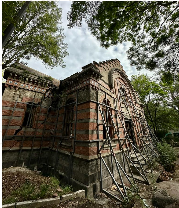
Casa de Bombas Nativitas, Xochimilco

Ejemplo del deterioro del patrimonio cultural del país es la Casa de Bombas de Nativitas , ubicado en la alcaldía Xochimilco, pues a pesar de su importancia, afecto a patrimonio cultural por la SEDUVI y como conjunto arquitectónico por el INHA, se encuentra en total abandono, pues con los años no se le ha dado mantenimiento, además de haber sufrido daños con el sismo del 19 de septiembre de 2017, tal como se muestra a continuación: