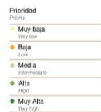
ÁREAS PRIORITARIAS PARA LA CONSERVACIÓN DE LOS SERVICIOS AMBIENTALES PRIORITY AREAS FOR ENVIRONMENTAL SERVICES CONSERVATION

Muestra de lo anterior, es el porcentaje perdido de suelo de conservación y el incremento de las zonas urbanas de nuestra ciudad con el paso de los años, En 2016 el área prioritaria para la conservación de los servicios ambientales correspondía a lo siguiente 2 :