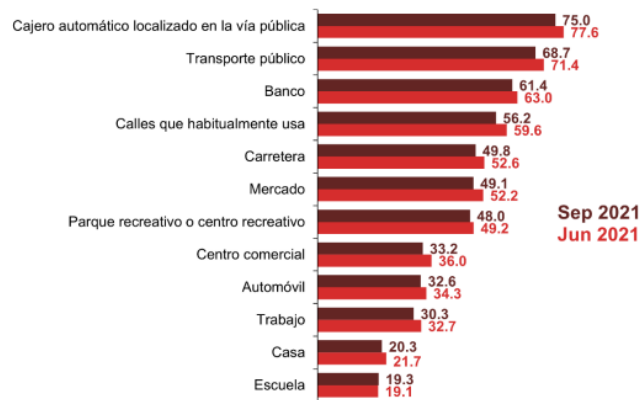
PORCENTAJE DE LA POBLACIÓN DE 18 AÑOS Y MÁS QUE SE SIENTE INSEGURA POR TIPO DE LUGAR JUNIO DE 2021 Y SEPTIEMBRE DE 2021 (Porcentaje)

Esto, se materializa dentro de la Encuesta Nacional De Seguridad Pública Urbana (ENSU), de 2021, citada anteriormente, en la que se puede apreciar que el 75% de la población siente inseguridad en los cajeros automáticos localizados en la vía pública, 68.7% en el transporte público, 61.4% en el banco y 56.2% en las calles que habitualmente usa.