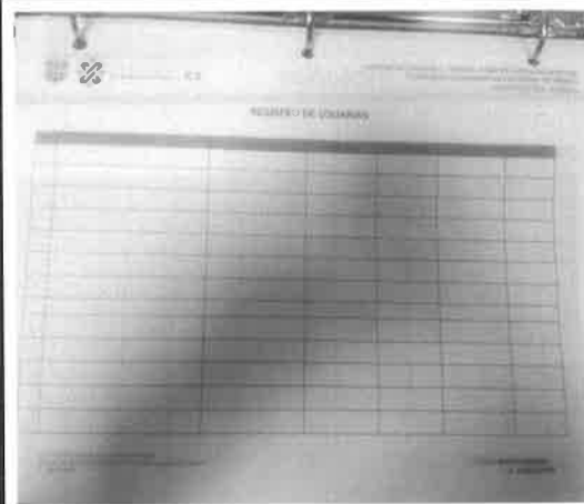
Formato registro usuarias