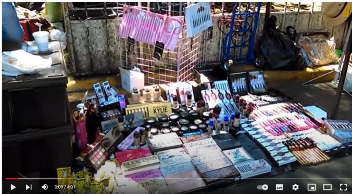
Cosméticos chinos, un riesgo para la belleza

A partir del 2016 y 2017 se ha venido alertando sobre esta problemática contra la salud, sin embargo, no se ha tenido un impacto contundente y por lo contrario, como se expuso al inicio de la presente proposición con punto de acuerdo, la adquisición de este tipo de productos sigue incrementado de manera sustancial, pese a las múltiples investigaciones 7 y reportajes 8 :