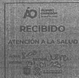
MARÍA ANTONIETA HIDALGO TORRES DIRECTORA GENERAL DE DESARROLLO SOCIAL