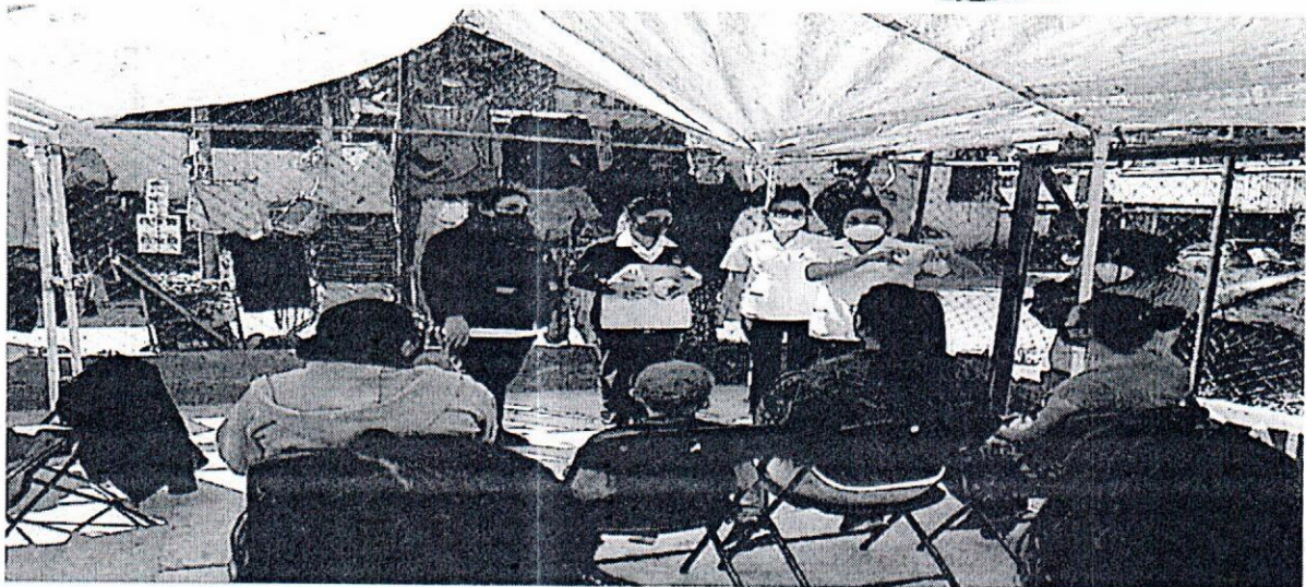
Pláticas informativas sobre Cáncer de mama

Asimismo, el pasado 09 de mayo del presente año, la Alcaldía firmó Convenio de Colaboración con el Instituto Nacional Ciencias Médicas y Nutrición Salvador Zubirán, el cual tiene como objetivo realizar 1,000 mastografías gratuitas a las mujeres de la demarcación para este año.